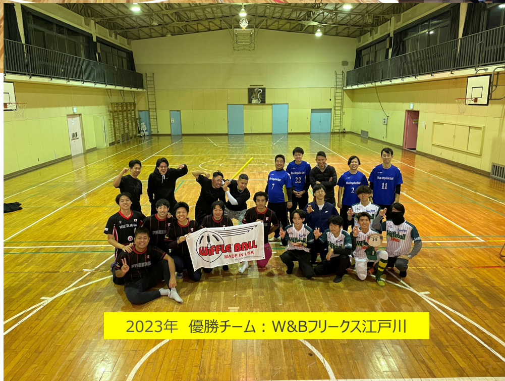
2023年 優勝チーム：W&Bフリース江戸川