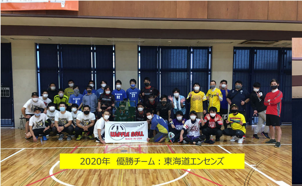
2020年 優勝チーム：東海道エンセンズ